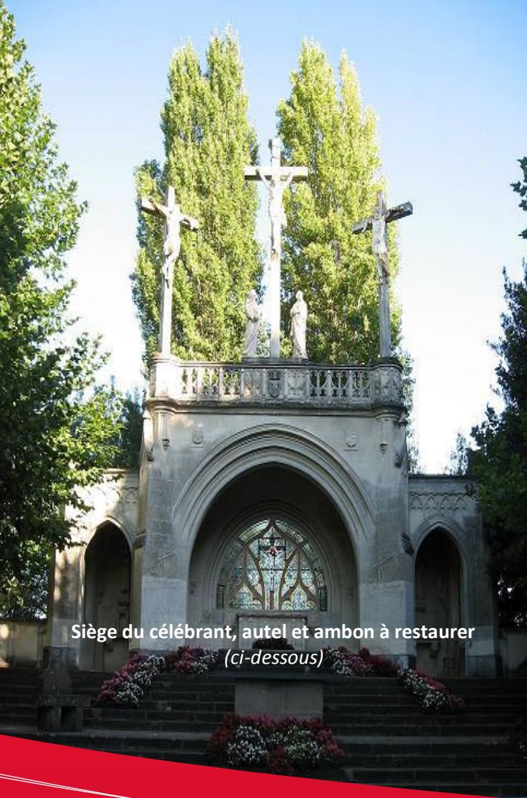
Siège du célébrant, autel et ambon à restaurer (ci-dessous)