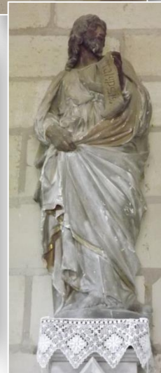
Les 4 statues de la chapelle objet du projet de restauration