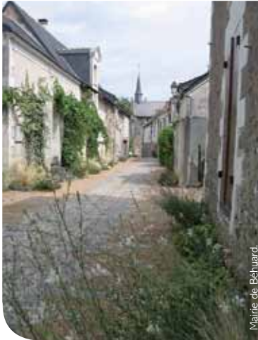
Rue Chevalier Buhard

Béhuard, la plus « Petite Cité de Caractère » d'Anjou et des Pays de la Loire ne compte qu'une centaine d'habitants à l'année. Labellisée en 2004, ce prestigieux label permet à cette petite cité, aux multiples charmes, d'accueillir de nombreux visiteurs.