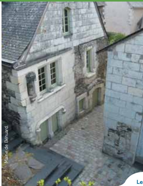
Le Logis du Roy